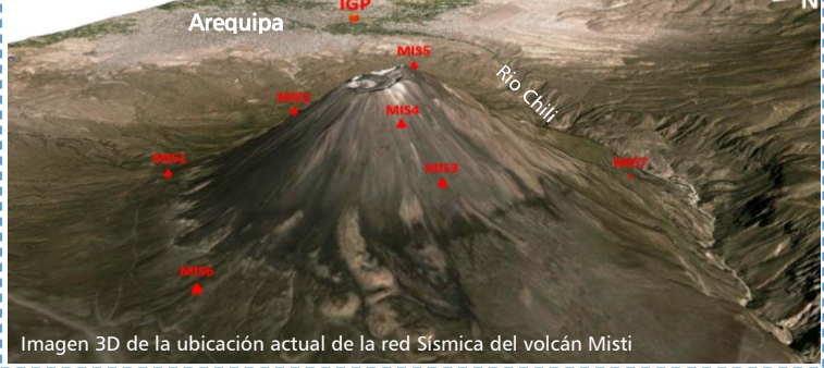
Imagen 3D de la ubicación actual de la red Sísmica del volcán Misti

La vigilancia de parámetros físicos y químicos de la actividad volcánica ayuda a investigar y avanzar en la comprensión del funcionamiento interno de los volcanes. El Observatorio Vulcanológico de Arequipa (OVA-IGP) usa la sismología volcánica como herramienta principal, para detectar las primeras señales de reactivación volcánica. El volcán Misti tiene una red de 08 estaciones sísmicas sobre el edificio que envían su señal a nuestro laboratorio en tiempo real . En complemento, se dispone de otras 04 estaciones satelitales y 08 estaciones fijas, de la Red Sísmica Nacional (RSN) que operan en el sur del país ininterrumpidamente y en tiempo real.