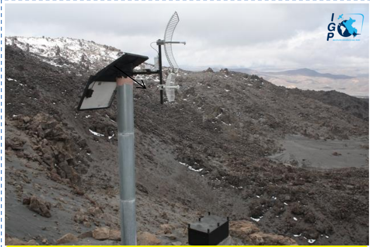
Estación sísmica TELEMETRICA SAB (a 3 km del cráter, 5209msnm).