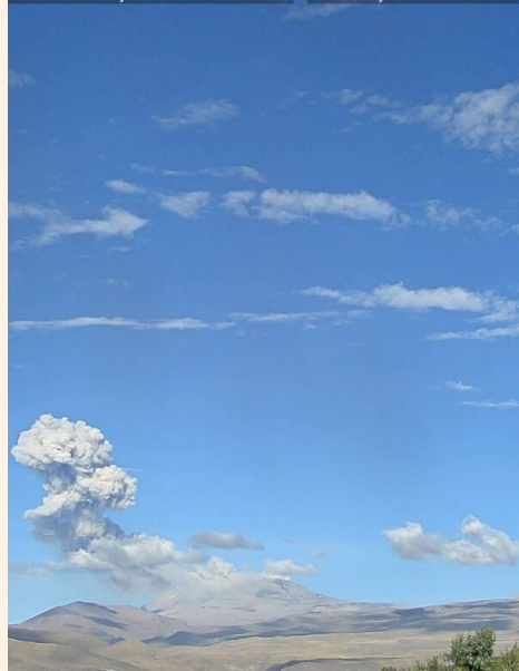
Emisión de ceniza y gases (27 de mayo de 2017)

Volcan Sabancaya / OVI - INGEMMET / Sat 27 May 08:12:02 PET 2017