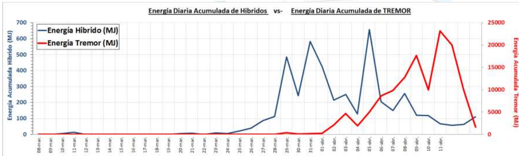
Figura 2.- Grafico que resume de la actividad sísmica principal, en AZUL Energía de Sismos HIBRIDOS, en mega-joules, y en ROJO Tremores en mega-Joules, registrada por la Red Sísmica IGP. Si bien ambos parámetros presentan valores bajos, ello no indica una disminución de la actividad pues esta asociado a la acumulación de presiones.

- En la erupción de 2006 las explosiones alcanzaron hasta 720 Mega Joules (MJ) de energía y alturas de hasta 4000 m por encima del cráter. Actualmente (en los últimos 2 días) la energía de cinco explosiones han sobrepasado los 600 MJ en energía, aunque la columna de ceniza ha llegado solo a los 3000 m como máximo. Hubo una explosión (Fecha: 13 abril a las 16:02 hora local) que alcanzo alta energía (2360 MJ)