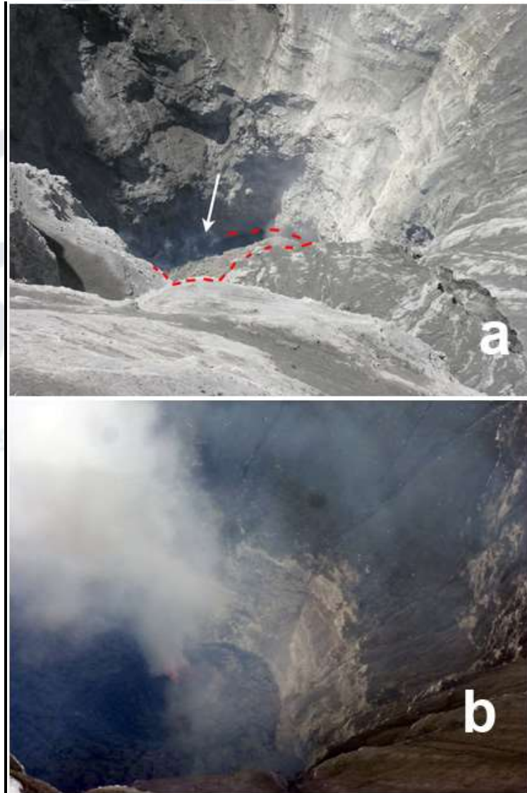
Figura 1.- Fotografías del estado del fondo del cráter (a) día 01 Marzo: la lava aparece recién, es visible, en el fondo del cráter; (b) día 19 Marzo: la lava ha llenado toda la base del cráter. Actualmente este panorama cambia día a día, pues en cada explosión/exhalación llega y también se remueve materiales.

- La actividad eruptiva magmática del volcán Ubinas continúa. Al respecto, recuérdese que el magma fue visto por vez primera en superficie por vulcanólogos del IGP el día 01 de Marzo. También, el día 19 de marzo se pudo constatar que la lava (es decir el magma en superficie) había ocupado un espacio de unos 150 metros de diámetro en el fondo del cráter. Desde entonces las exhalaciones y explosiones que ocurren vienen cargadas de ceniza (la cual es hoy magma pulverizado).